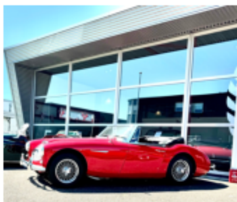
Austin Healey 3000 MK2, bouwjaar 1963