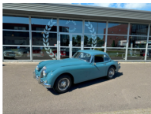
Jaguar XK150 SE FHC 3.4, bouwjaar 1959